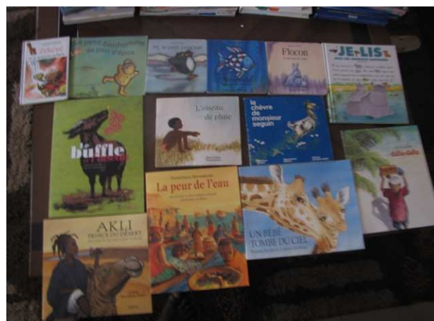
Voici une part des fournitures scolaires rescapées de notre envoi par bateau à Dakar. En effet, une bonne partie de ces fournitures a disparu au port de Dakar. Merci à Dominique qui a collecté ces fournitures à Chatou.