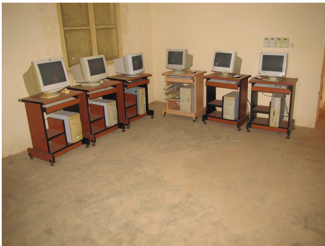
La salle informatique du Lycée de Douentza que nous avons équipée en 2008 est restée vide malgré la formation des enseignants. On nous promet un redémarrage à la rentrée d'octobre 2010 après une réorganisation interne ...