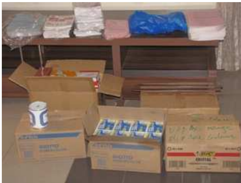
Achat des fournitures scolaires à Bamako (cahiers, craies, gommes, crayons, stylos, ... )